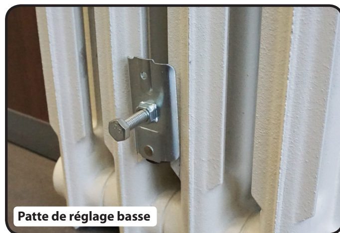
Patte de réglage basse