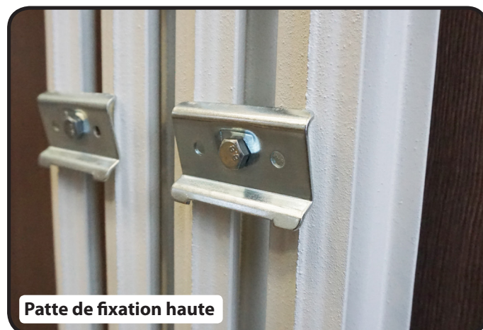
Patte de fixation haute