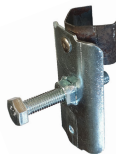
PATTE DE RÉGLAGE BASSE