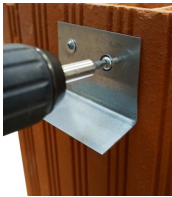
Vis à brique - vue en situation