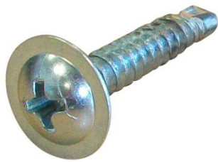
Vis à brique