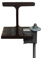
Suspente bord de tôle avec tige filetée