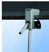
Suspente bord de tôle avec tige lisse