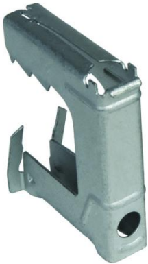
Suspente bord de tôle