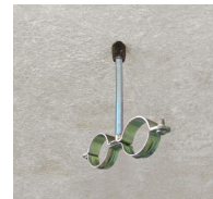
Rapido M7 - vue en situation