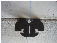
Suspente hourdis béton - vue en situation