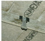
Suspente hourdis béton + suspente bois