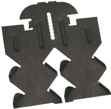
Suspente hourdis béton