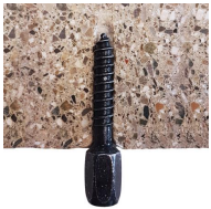
Rapido - Vue en coupe