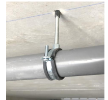
Rapido M8 - vue en situation