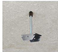
Rapido M6 - vue en situation