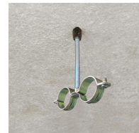
Rapido M7 - vue en situation