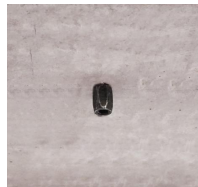
Rapido - Vue en situation