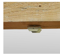
Piton rénovation mâle M6 + cavalier