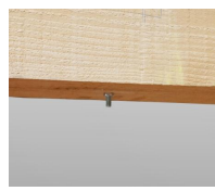
Piton rénovation mâle M6 - vue en situation