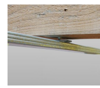
Piton rénovation mâle M6 + cavalier et fourrure