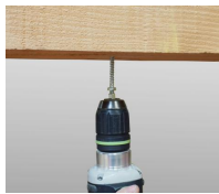
Piton rénovation mâle M6 - mise en oeuvre