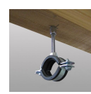
Piton rénovation femelle M8 - vue en situation