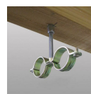
Piton rénovation femelle M7 - vue en situation