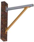
Renfort pour console - vue en situation