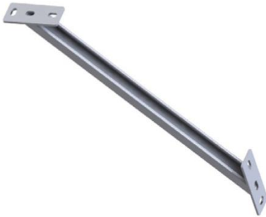
Renfort pour console