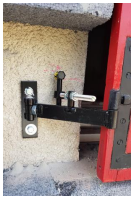
Pièce pour gond en angle - vue en situation