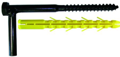
Pièce pour gond en angle