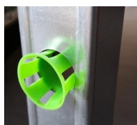
PASS-RING - vue en situation