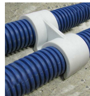
FIX-RING Double - vue en situation