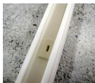
FIX-ELEC - vue en situation