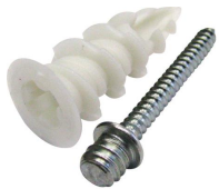
Cheville Plak nylon avec patte à vis M7