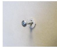
Cheville Plak nylon - vue en situation