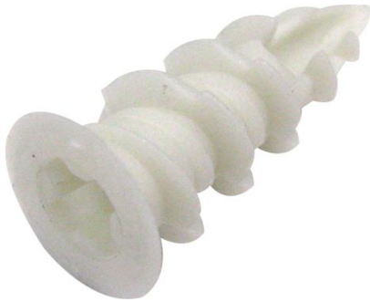
Cheville Plak nylon