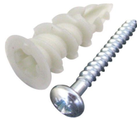
Cheville Plak nylon avec vis tête ronde