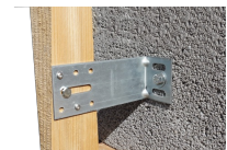
Cheville parpaing - Vue en situation