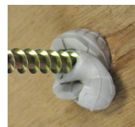
Cheville IXE - noeud dans les matériaux creux