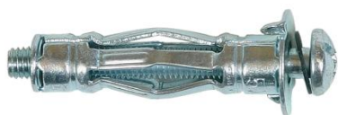
Cheville Brik avec vis