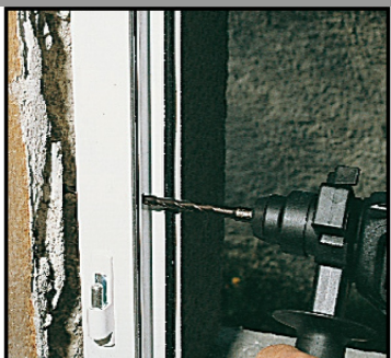
2. Percer un trou \varnothing 8 mm dans le mur au travers de la menuiserie