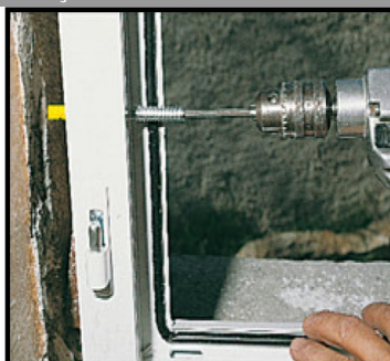
3. Enfoncer la cheville + la vis au travers de la menuiserie puis visser.