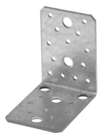
Équerre renforcée sans renfort