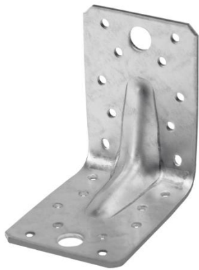
Équerre renforcée avec renfort