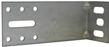
Equerre de bardage galvanisée