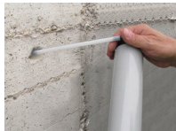
Pompe soufflante - Vue en situation