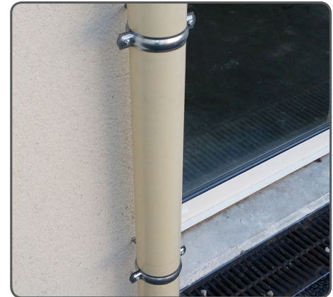
Collier descente eaux pluviales