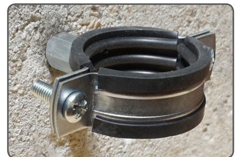
Collier série lourde