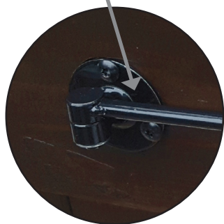
1 Platine ronde