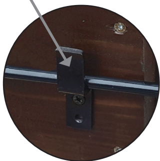
2 Butée de maintien