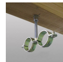
Piton rénovation femelle M7 - vue en situation