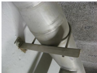
Etrier - vue en situation