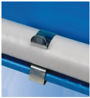
Clip bord de tôle - vue en situation