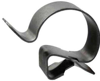
Clip bord de tôle