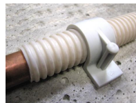
FIX-RING Simple - vue en situation