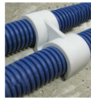
FIX-RING Double - vue en situation