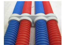
FIX-RING Quadruple - vue en situation