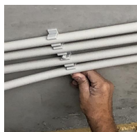
FIX-RING Multi électricité - clipsage à la main