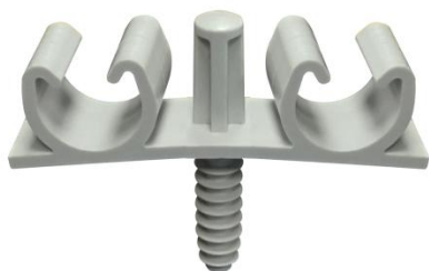
FIX-RING Multi électricité double