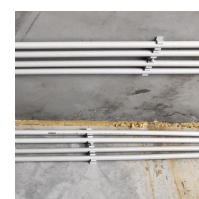
FIX-RING Multi électricité - tube IRO