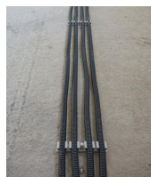
FIX-RING Multi électricité - gaine ICT