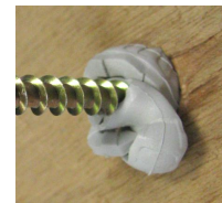
Cheville IXE - noeud dans les matériaux creux