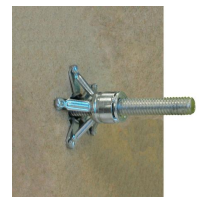
Cheville Brik - vue de derrière