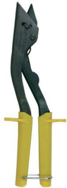
Pince Brik n°1