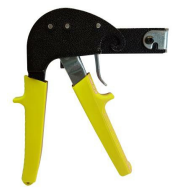
Pince Brik n°6