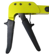
Pince Brik n°5