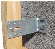
Equerre de bardage galvanisée - vue en situation