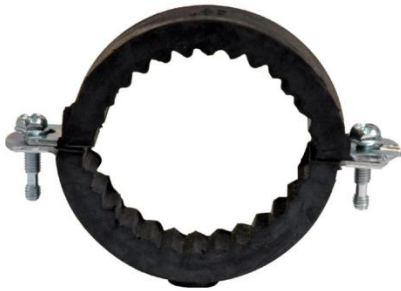
Collier 2 vis isolé isolant épais