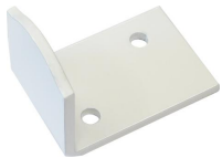
Battement bas ISO pour espagnolette - Epoxy blanc