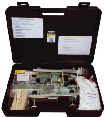
Mallette de pose complète