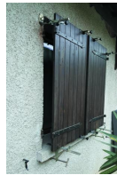
Mallette de pose complète ITE - vue en situation