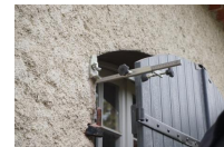
Mallette de pose complète ITE - vue en situation